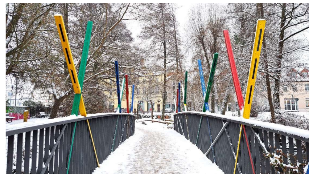
Eberswalde im Winter: Amazone am Weidendamm, AWO-Heim und Zentrale an der Frankfurter Allee, Altstadtcarree (leicht bearbeitet), Finowfurter Bus an der Eisenbahnstraße, Mikadobrücke zwischen der Michaelis- und Goethestraße und das verschneite Drehnitzfließ