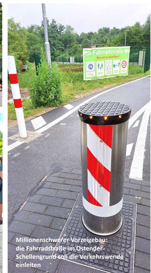
Millionenschwerer Vorzeigebau: die Fahrradstraße im Ostender Schellengrund soll die Verkehrswende einleiten