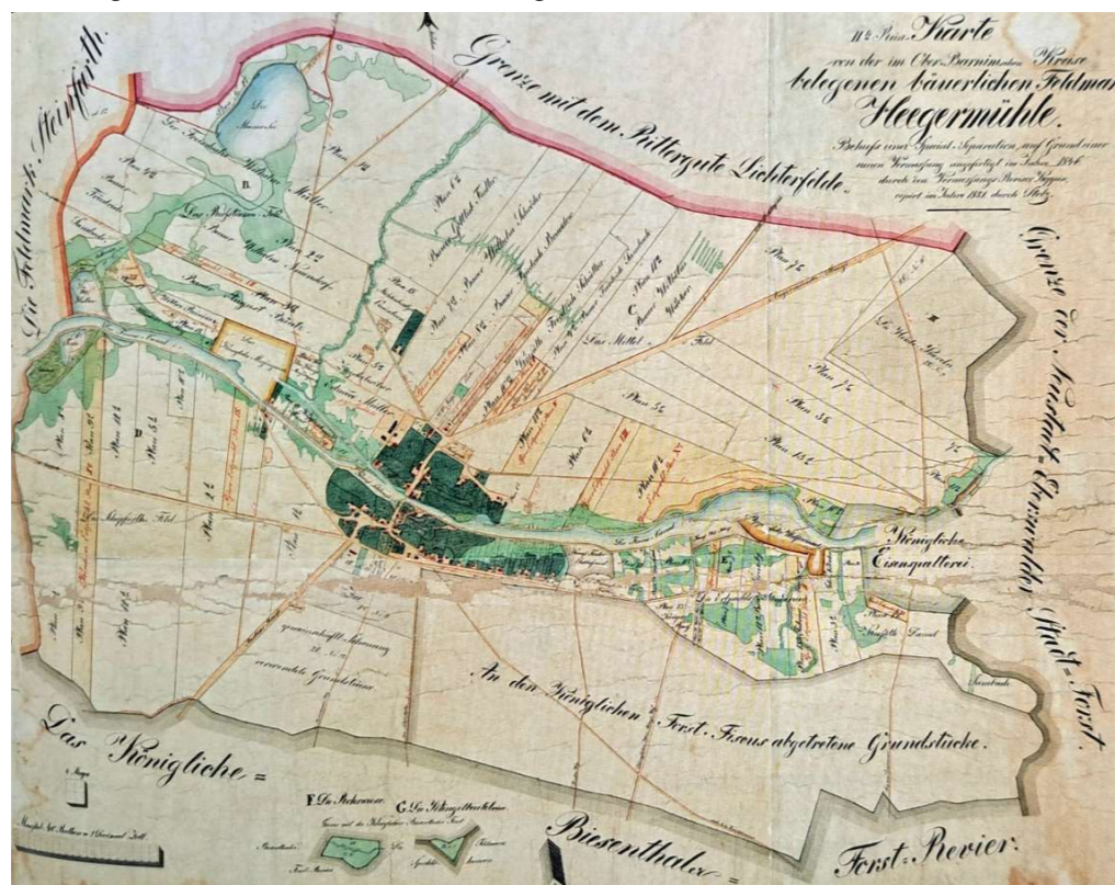
Bäuerliche Feldmark Heegermühle von 1846