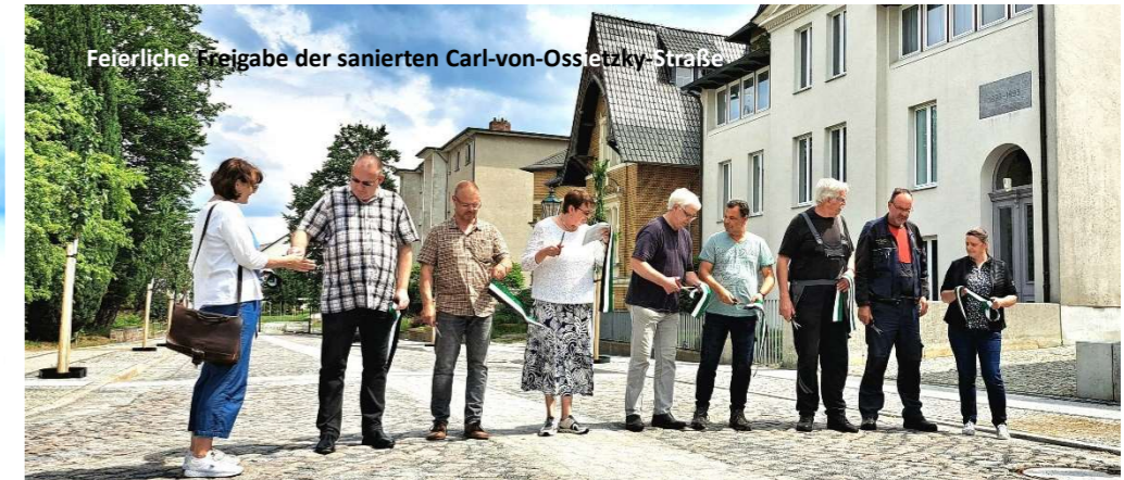
Feyerliche Freigabe der sanierten Carl-von-Ossietzky-Straße