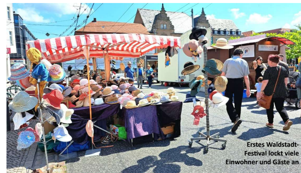
Erstes Waldstadtfestival lockt viele Einwohner und Gäste an