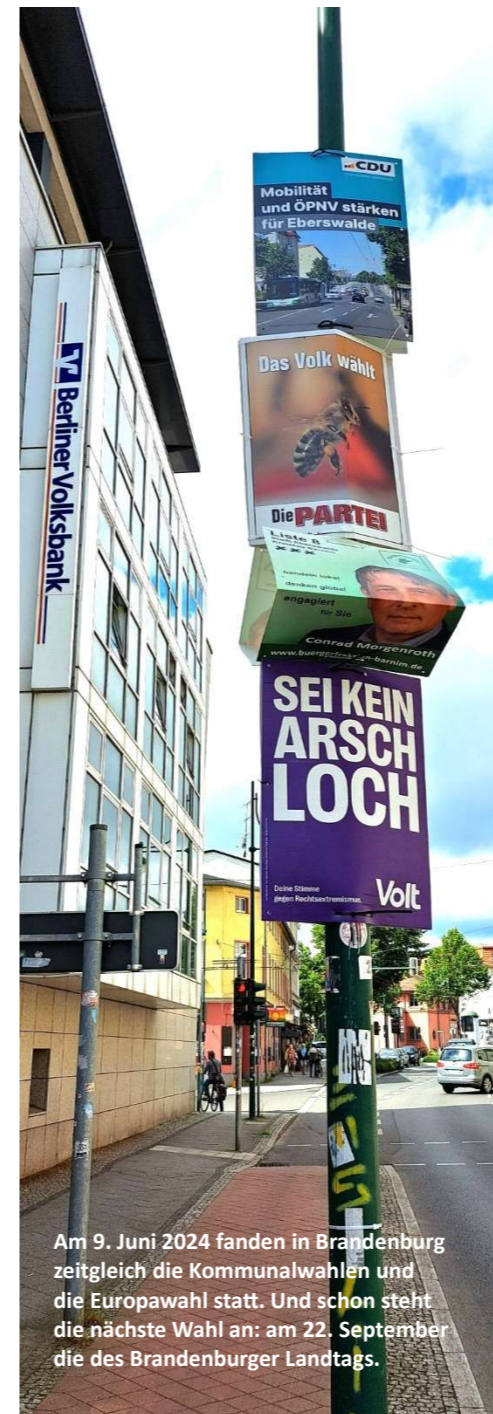
Am 9. Juni 2024 fanden in Brandenburg zeitgleich die Kommunalwahlen und die Europawahl statt. Und schon steht die nächste Wahl an: am 22. September die des Brandenburger Landtags.