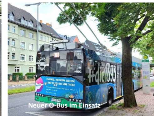
Neuer O-Bus im Einsatz